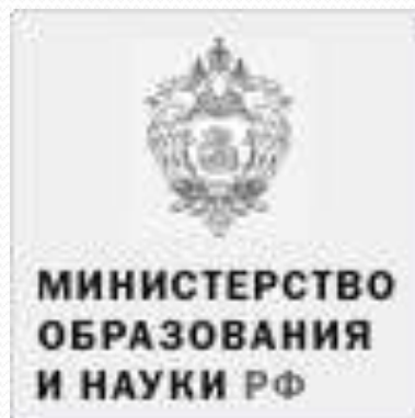
МИНИСТЕРСТВО ОБРАЗОВАНИЯ И НАУКИ РФ