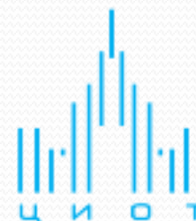
Центр интерактивных образовательных технологий МГУ имени М.В.Ломоносова