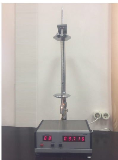
Рис. Установка польского класса “ELWRO” по исследованию колебаний физического маятника

Например, установка польского класса “ELWRO”, по исследованию колебаний физического маятника была взята за основу для изготовления подобной для работы лабораторного физического практикума. Механическая часть установки не представляет собой сложности в изготовлении (стержень, призмы, чечевицы, корпус и стойка). Основным интерес для учащихся представлял интеллектуальный блок для организации измерения промежутков времени в автоматическом режиме. У оригинальной установки был взят внешний вид табло, а схемотехника устройства была разработана на базе “ARDUINO”. В связи с тем, что подобная плата, датчики, LCD экран в качестве питания требуют стандартные 5В, то это позволяет не использовать для работы установки сеть 220В. Задействование DC преобразователя позволило запитать установку от стандартной батарейки 1,5В. Сборка установки (интеллектуальной части) заняла стандартный урок; на написание проверки и отладку кода было затрачено два урока.