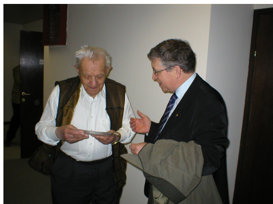
Рис. 1. Академик РАО Н.К. Сергеев вручает приглашение возглавить конференцию академику РАН С.М. Никольскому

Содружество Межрегиональной общественной организации «Академия информатизации образования» (АИО) и Волгоградского социально-педагогического государственного университета (ВГСПУ) продолжается уже много лет. Достаточно вспомнить цикл совместных конференций проводимых в г. Волгограде на базе университета. Ярким событием для нашего содружества (Университета и Академии) была, проведенная на базе Университета в 2006 г., Международная конференция «Современные проблемы преподавания математики и информатики». Почетным председателем конференции был патриарх российской науки, великий математик, Легенда века (101 год в 2006 г.) – академик РАН С.М. Никольский [5].