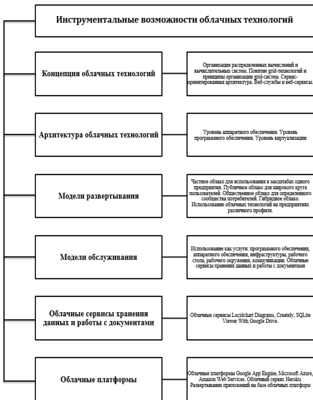
Рис. 2. Содержание модуля «Инструментальные возможности облачных технологий»

Таким образом, анализ современной нормативно-правовой базы и результатов двустороннего анкетирования позволили определить уровень необходимой корреляции требований ФГОС ВО и профессиональных стандартов к будущим специалистам в области ИСИТ в вопросах использования облачных технологий, что помогло скорректировать рабочие программы курсов, а также адаптировать существующие методики обучения.