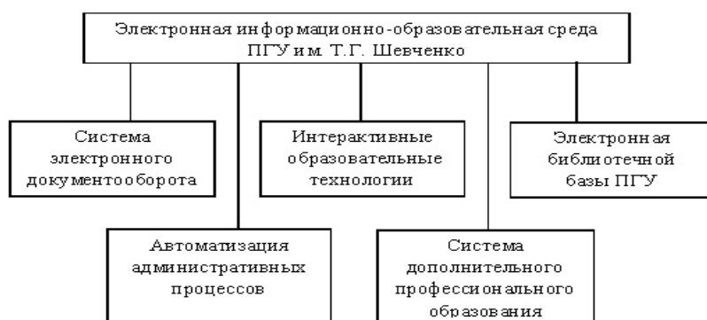
Рис. 1. Схема электронной информационно-образовательной среды ПГУ

Построение ЭИОС в Приднестровском государственном университете началось более пятнадцати лет назад с создания отдельных административных информационно-справочных программных комплексов, которые позволили решить проблему адекватности и прозрачности всего процесса приемной кампании, а также решить проблему учета успеваемости контингента студентов. Далее последовало создание электронного документооборота на платформе “ IBMLotus/Notes ” и интерактивного образовательного портала на платформе “ Moodle ”. Общая схема электронной информационно-образовательной среды Приднестровского государственного университета (ПГУ) представлена на рис. 1.