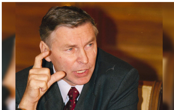
Рис. 3. Глава ВАК Российской Федерации, ректор РУДН профессор В. М. Филиппов

Три года назад мы создали при Академии компьютерных наук (АКН) и Академии информатизации образования международный Аттестационный совет по приему к защите и проведению процедур защиты научных докладов и диссертаций на соискание степени доктора “Ph.D” по направлениям, обозначенным в реестре европейского сообщества. При защите докладов на соискание степени «Доктор философии» (Ph.D), общественной научной оценки идей научных и практических результатов наших коллег, мы намечаем и выдвигаем лучшие успешные работы. Подобных советов в стране около 40. В международном Академическом аттестационном совете при АИО и АКН за эти годы состоялось уже 17 защит докладов на соискание степени «Доктор философии» (Ph.D) по различным областям. Совет продолжает активно работать, 24 апреля 2019 г. состоялась очередная защита. Необходимо напомнить выдержку из резолюции нашей конференции «ИО-18»: «Способствовать активизации участия в организации информационного взаимодействия между отделениями Академий и их членами, научно-педагогическими кадрами, профессорско-преподавательским составом российских вузов и научно-исследовательских институтов России и стран СНГ в процессе проведения в Современной гуманитарной академии научных чтений, заседаний по присвоению степени «Доктор Философии» (Ph.D), а также тематических конференций.