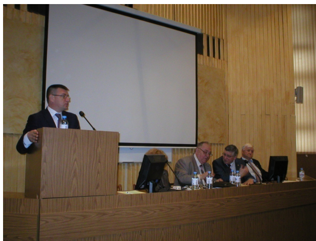
Рис. 2. Международная научно-практическая конференция ИО-14. Пленарный доклад министра образования и науки Волгоградской области профессора А.М. Короткова. (г. Волгоград, 23–26 апреля 2014 г.)

Сюда же необходимо отнести и проведение конференций, подготовленных членами Академии, сотрудниками университета, вспомнить добрым словом настоящего организатора – профессора В.И. Данильчука.