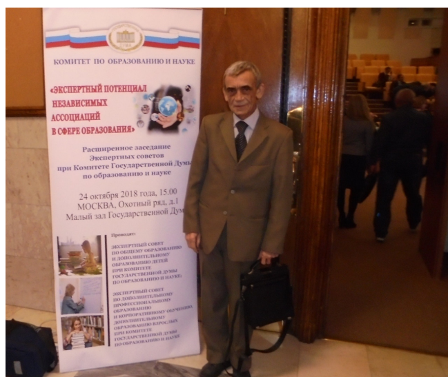
Рис. 4. Президент Академии информатизации образования профессор А.А. Русаков перед заседанием экспертных советов Комитета по образованию и науке

мативно-правового регулирования с целью полноценного использования цифровых технологий в сфере образования. Эти предложения разработаны во исполнение п. 5 Указа Президента РФ от 7 мая 2018 г. № 204 – решения задачи Национального проекта в сфере образования по созданию современной и безопасной цифровой образовательной среды, обеспечивающей высокое качество и доступность образования всех видов и уровней. Наши предложения прошли предварительные слушания в министерстве Высшего образования и науки и признаны Комитетом по образованию и науке ГД Федерального собрания РФ как своевременные и правильные вещи . АИО является членом Экспертного Совета и я выступал на расширенном заседании экспертных советов Комитета по образованию и науке ГД Федерального собрания РФ 24 октября 2018 г., председателем которого являлась Л.Н. Духанина (заместитель председателя Комитета по науке и образованию). Тема заседания – Экспертный потенциал независимых ассоциаций в сфере образования . Также присутствовали руководители министерств, эксперты со всей территории РФ. В своем выступлении мы познакомили с тематикой работы нашего Союза академий. Ведется работа и по инициации изменений в законодательство, подзаконные акты и другие нормативно-правовые акты в интересах совершенствования системы образования РФ.